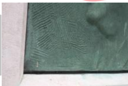
signatura (2/2023, KK)