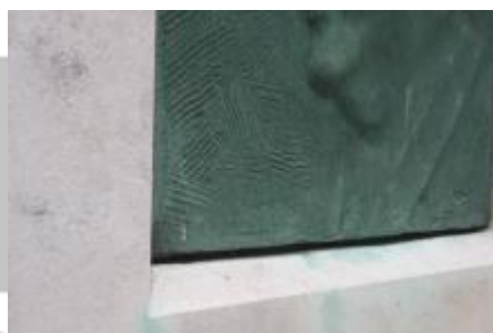
signatura (2/2023, KK)