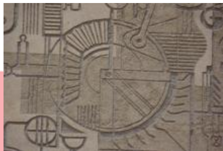
kombinace hladké a strukturované omítky (9/2016, VR)