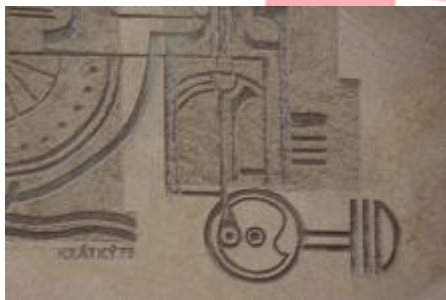
signatura (9/2016, VR)