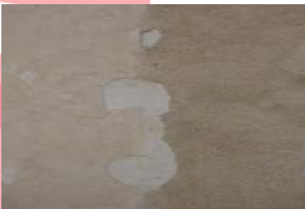
detail poškození - olupování od podkladní vrstvy (9/2016, VR)