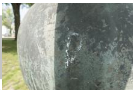
veřejném prostoru restaurování