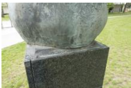
České umění 50.— evidance / p