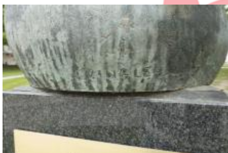
signatura, 4/2018 MČ