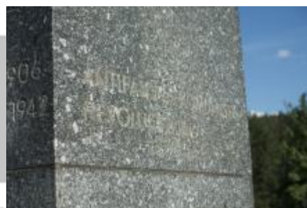
veřejném prostoru restaurování