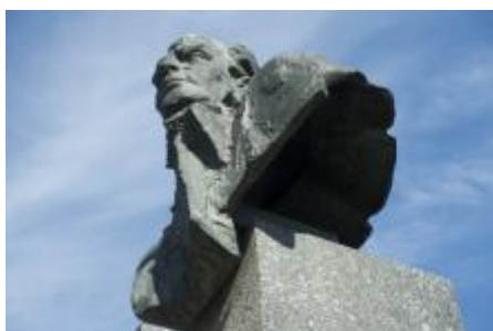
České umění 50.— evidence / p