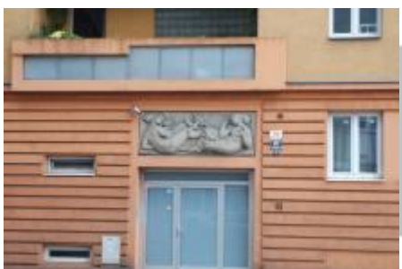
České umění 50.— evidence / p