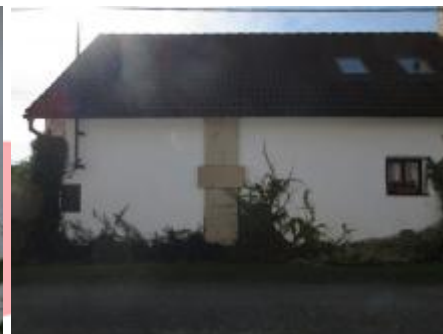
Celkový pohled, 6/2018 EGr