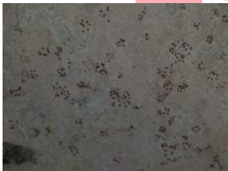
Biologická koroze, 6/2018 EGr