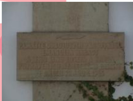
Pamětní deska, 6/2018 EGr