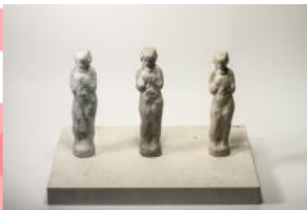
Socha Hudba - studie.