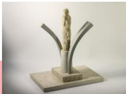
Socha Hudba - studie.