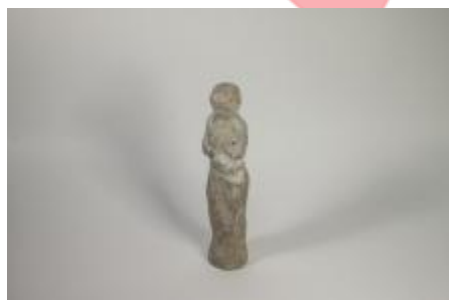
Socha Hudba - studie.