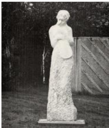
Socha Hudba, 1988. Zdroj: ©Ludmila Jandová Grafika a obrazy, František Janda Sochy, (kat. výst.), Svitavy 1988.