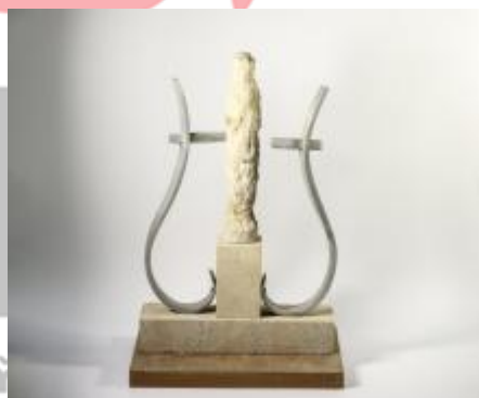
Socha Hudba - studie.