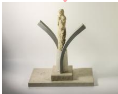
Socha Hudba - studie.