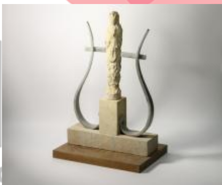
Socha Hudba - studie.