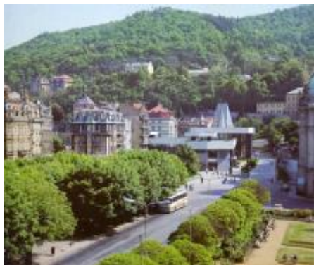
Původní umístění před Vřídelní (Gagarinovou) kolonádou; Ladislav Neubert - Bohumír Mráz, Karlovy Vary, Praha 1977.