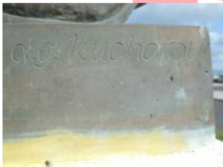
signatura 8/2016 TR