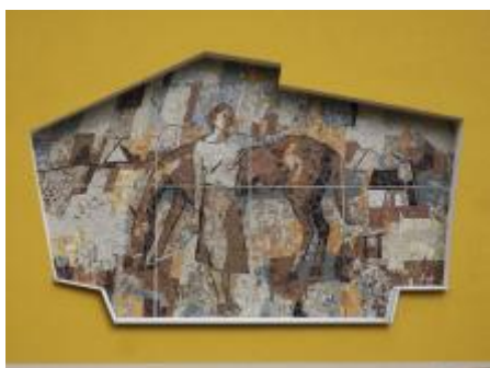
Čelní pohled (08/2018/JJ)