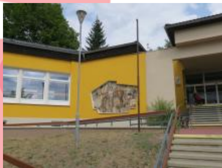
Pohled na mozaiku vlevo od vchodu (08/2018/JJ)