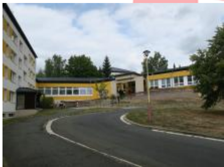
Celkový pohled (08/2018/JJ)