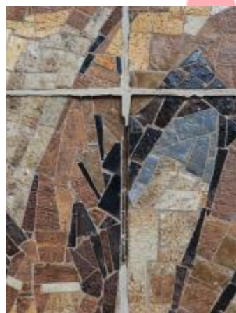
Poškození - zvětralé tmely (08/2018/JJ)