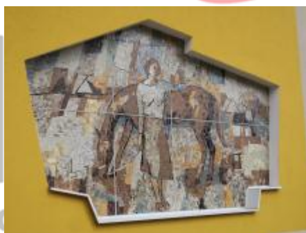
Boční pohled (08/2018/JJ)