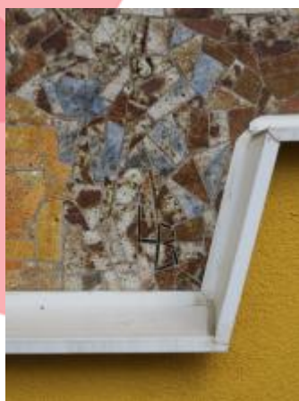
Detail - signatura, lišta zateplení fasády (08/2018/JJ)