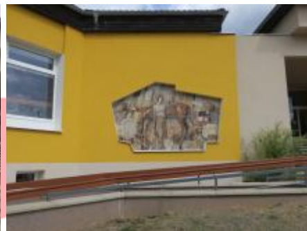
Čelní pohled (08/2018/JJ)