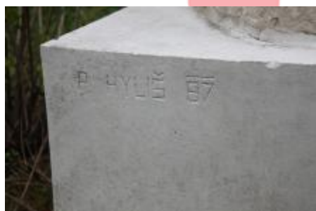
signatura (8/2017 KD)

SOCHY A MĚSTA České umění 50.—80. let ve veřejném prostoru evidance / průzkumy / restaurování