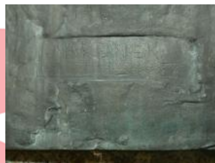
signatura na bustě (2/2022, KK)