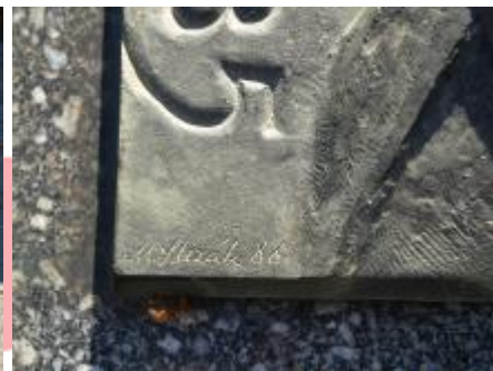
signatura na desce (2/2022, KK)