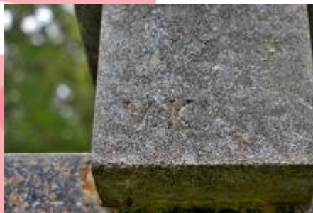
Signatura autora (09/2019/VD)