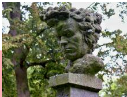
Detail busty (09/2019/VD)