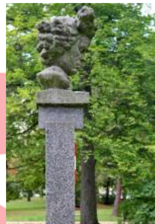
Boční pohled s měřítkem (09/2019/VD)