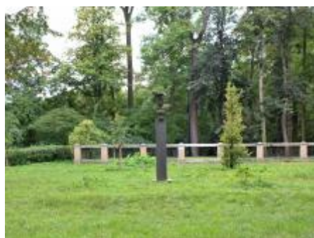
Kompozice díla v prostoru (09/2019/VD)