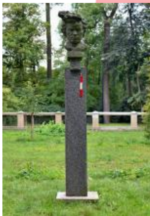
Čelní pohled na pomník s měřítkem (09/2019/VD)