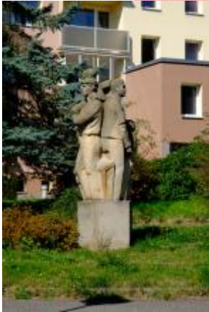
Celkový pohled z boku 08/2016 PHe