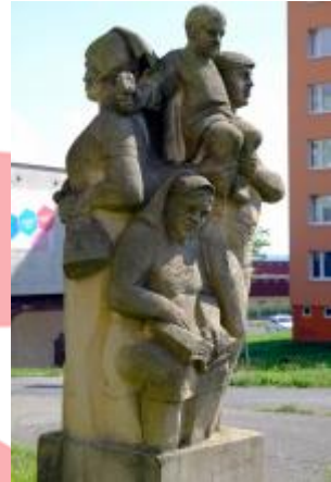
Druhá část sousoší s postavami důchodkyně a otce s malým dítětem 08/2016 PHe