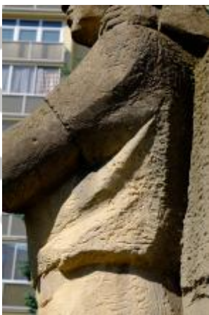
Detail povrchu sochy s počínajícím napadením lišejníky 08/2016 PHe