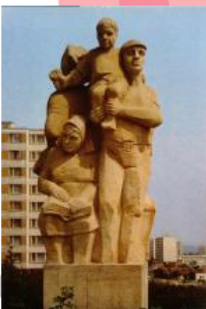
Jaroslav Karbaš, České výtvarné umění v architektuře 1945–1985, Praha 1985, s. 94.