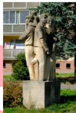
Celkový pohled na sousoší z boku 08/2016 PHe