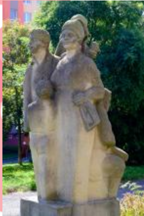
Detail první části sousoší s dvojicí pracujících 08/2016 PHe