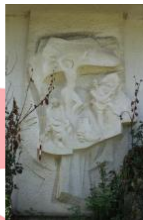
Celkový pohled 07/17 ML