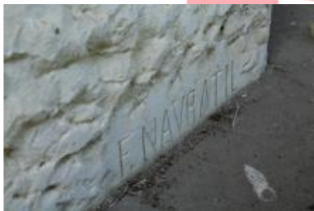
Signatura díla 07/17 ML