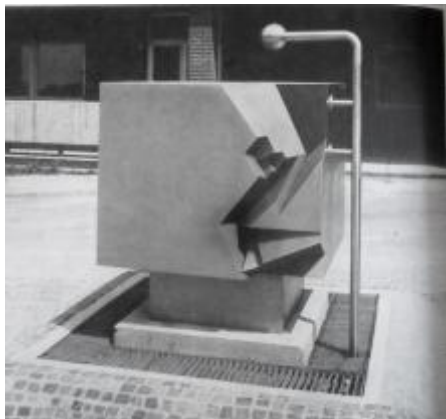
Svoboda, kašna VŠE, Výtvarná kultura, 1989, č. 6