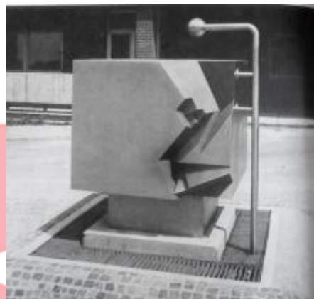
Svoboda, kašna VŠE, Výtvarná kultura, 1989, č.6