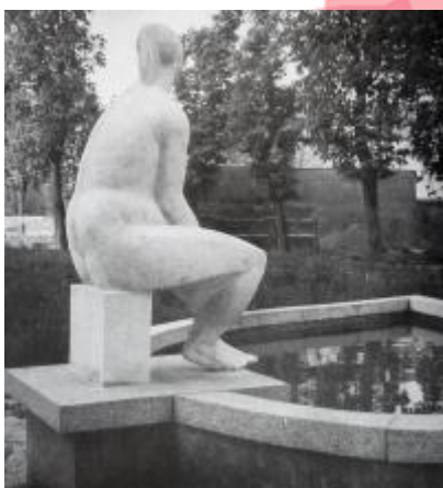
Blanka Stehlíková, Socha v architektuře, Výtvarná kultura XIII, 1989, č. 3, s. 53-57.