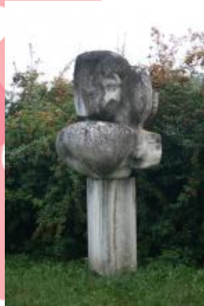
Přední pohled (09/2015/VD)