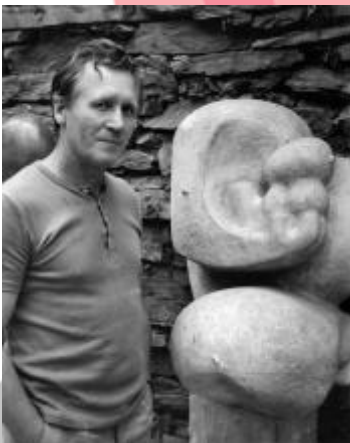
Sochař se skulpturou v ateliéru.