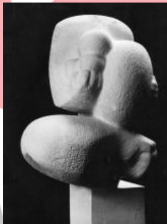
Mateřství (model).