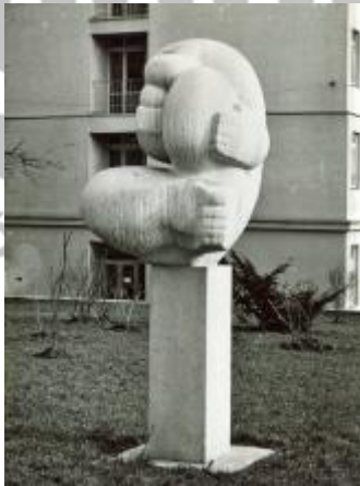
Po osazení.