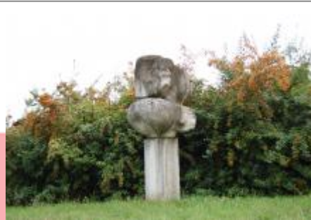
Celkový pohled (09/2015/JJ)