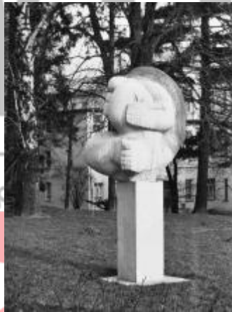
Fotografie objektu po osazení s autorskou kresbou tužkou.