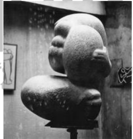
Model v ateliéru.