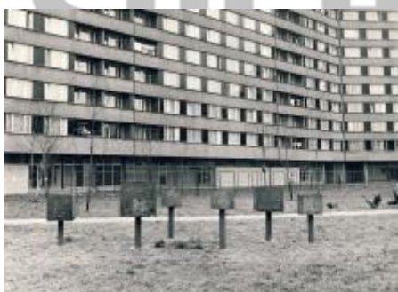
Zemský archiv v Opavě, 70. léta 20. století