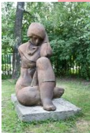
socha Sedící na zahradě rodinného domu Myszakových, která měla zřejmě původně stát na sídlišti Letiště, Ji 2014