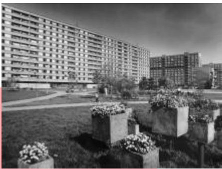
70. léta 20. století (?)