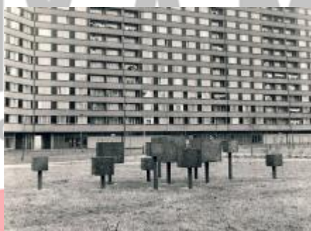
70. léta 20. století