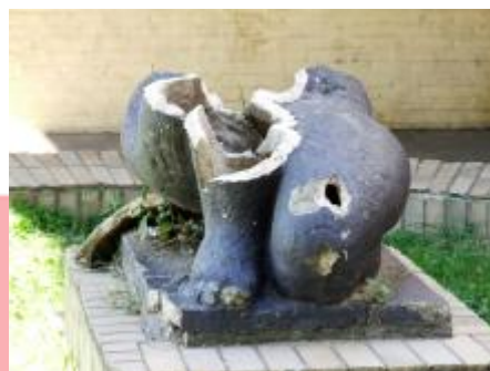
zbytky sochy před odstraněním, foto: Marie Šťastná, 2007