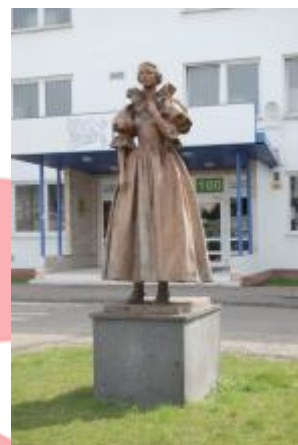
Čelní pohled na plastiku (04/2015/JJ)