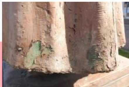
Loupající se vrstvy nátěru (04/2015/JJ)