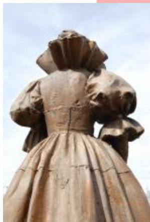
Pohled na zadní část plastiky (04/2015/JJ)