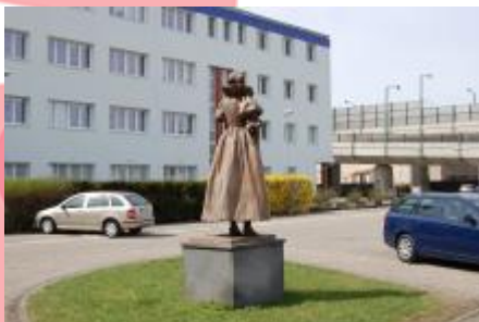
Pohled na zadní část plastiky (04/2015/JJ)