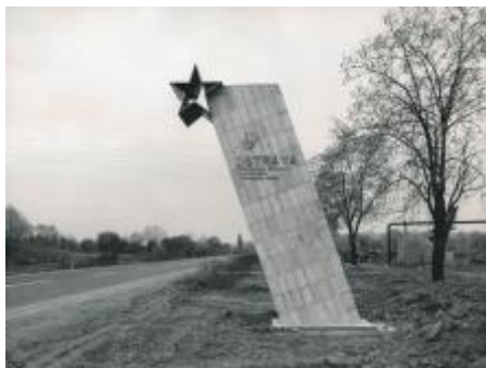
80. léta 20. století