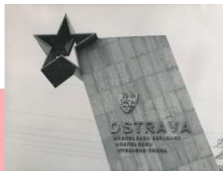
80. léta 20. století