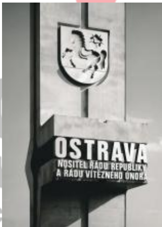
80. léta 20. století