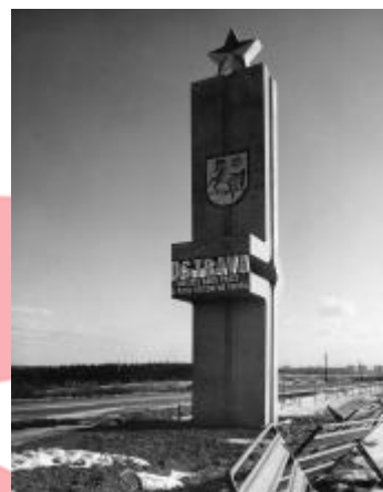
Zemský archiv v Opavě, foto Petr Sikula 80. léta 20. století