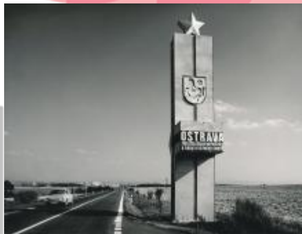
80. léta 20. století