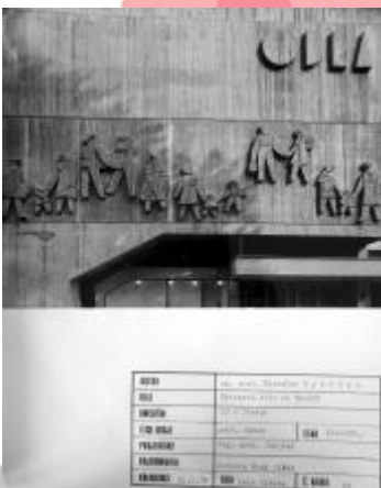
ZAO, fond: ČFVU - Dílo, Ostrava, Fotodokumentace, foto: 65.