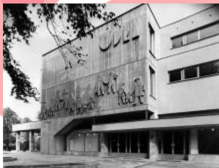
ZAO, fond: ČFVU - Dílo, Ostrava, Fotodokumentace, foto: 65.