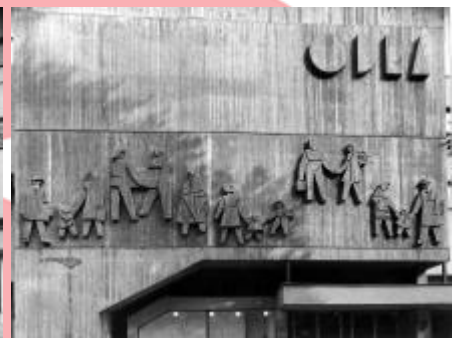
ZAO, fond: ČFVU - Dílo, Ostrava, Fotodokumentace, foto: 65.