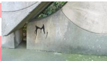
2016 LR - detail nátěru