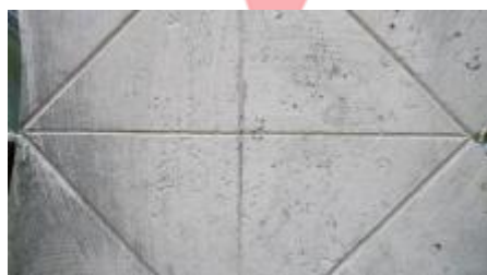
2016 LR - detail nátěru