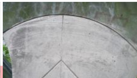
2016 LR - detail nátěru