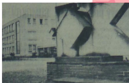
Nové Hradecko XX, 1978, č. 26, 27. 6., s. 3