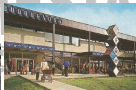
prodejna Budoucnost na výřezu z dobové pohlednice, soukromá sbírka pohlednic, foto Vítězslav Šolek 70. léta 20. století