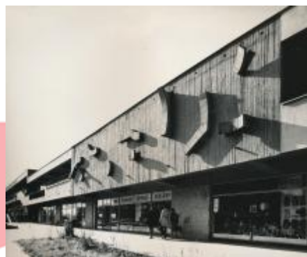
Archiv města Ostravy, foto Petr Sikula 70. léta 20. století