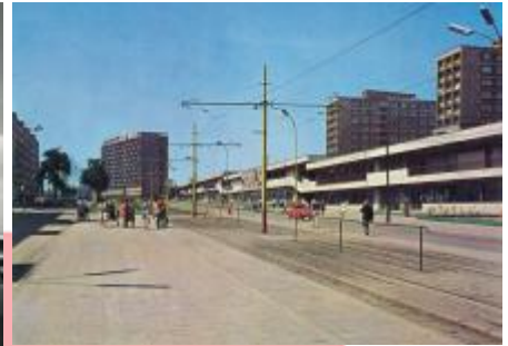
dobová pohlednice z počátku 70. let 20. století