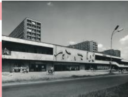
Archiv města Ostravy, foto Petr Sikula 70. léta 20. století