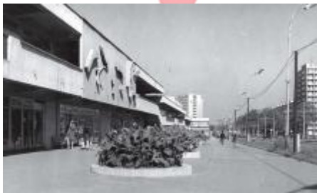
Archiv města Ostravy, foto Zdeněk Čermák 1970