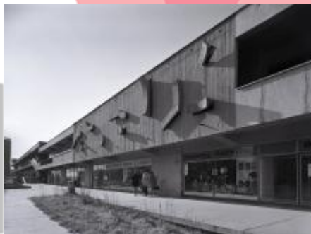
Archiv města Ostravy, foto Petr Sikula 70. léta 20. století