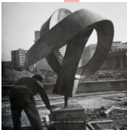
Kontinuita, pozůstalost Konráda Babraje.