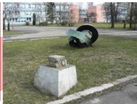
Kontinuita, povalená plastika s původním podstavcem po zrušení fontány, 2009/Kamil Křenek