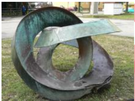
Kontinuita, povalená a poškozená plastika po zrušení fontány, 2009/Kamil Křenek