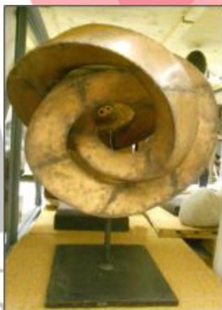
Kontinuita, model realizace, Muzeum města Brna.