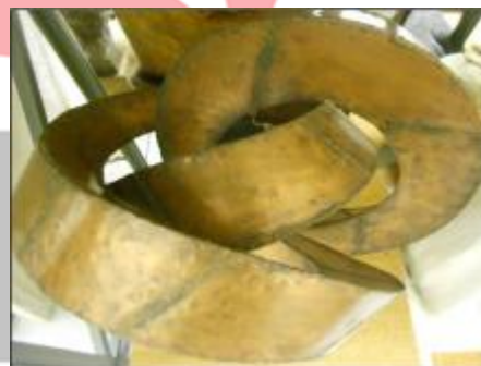
Kontinuita, model realizace, Muzeum města Brna.