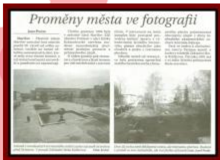
Moravskoslezský deník, 16. 12. 2006, č. 292, s. 5.