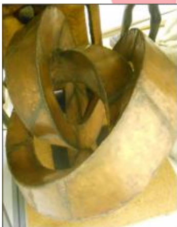
Kontinuita, model realizace, Muzeum města Brna.