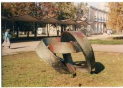
Kontinuita, povalená a poškozená plastika po zrušení fontány