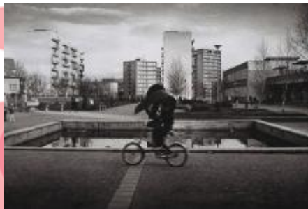
Kontinuita, archiv Muzea Těšínska, 1978/Drahošlav Ramík.