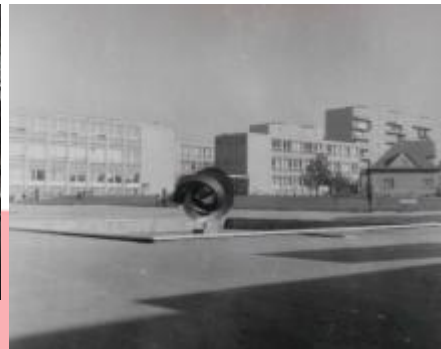
Kontinuita, pozůstalost Konráda Babraje.