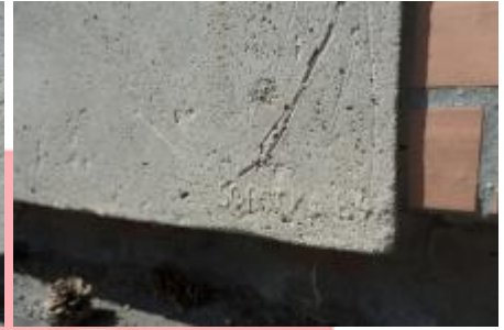
signatura, 5/2019 MČ