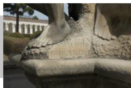
signatura, 4/2018 MČ