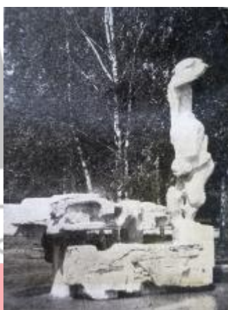
Jaroslav Sedlář, Plastiky Jiřího Marka, Československý architekt XIX, 1973, č. 5.