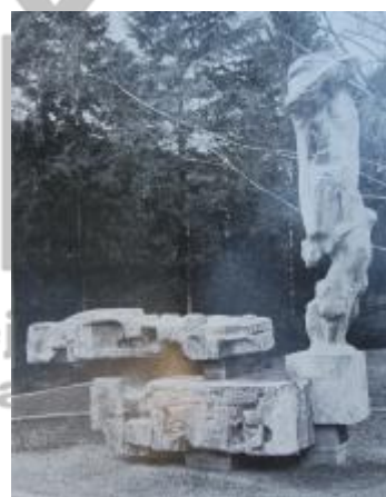
Iloš Crhonek - Nina Dvořáková - Milada Nováková - Eva Samková, Brno v architektuře a výtvarném umění, Brno 1981, s. 332.