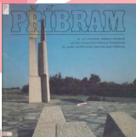
z knihy "Příbram. 35 let rozvoje okresu Příbram" asi z roku 1980