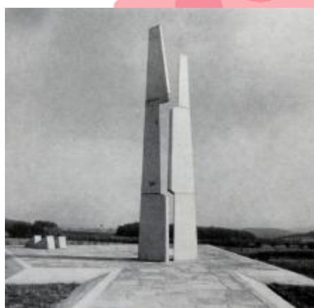
Josef Pechar, Československá architektura, Praha 1979.