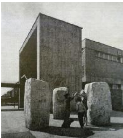
Chlupáč, plastika na sídlišti Pankrác, Československý architekt, 1973, č. 1, s. 1