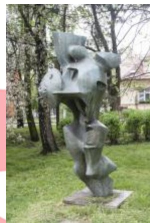
Památník osvobození 2017/JI