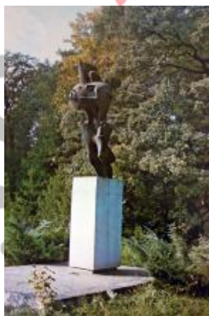
Umístění v sadu Boženy Němcové, foto Ivan Straňák, z publikace Okres Karviná, Ostrava 1984.