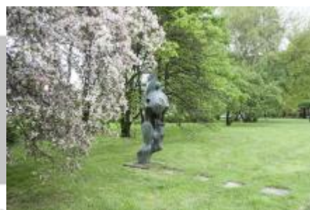
Památník osvobození 2017/JI