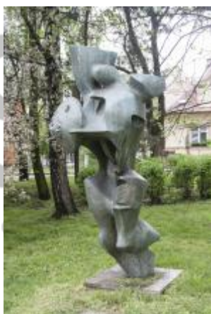
Památník osvobození 2017/JI