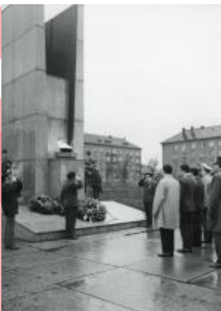
Po odstranění sochy bojovníka, asi 1972, SOKA Karviná, Sběrka obrazového materiálu, fotografií a fotonegativů, neinventarizováno.