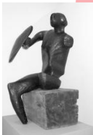
Henry Moore: Bojovník se štítem, 1953-54, Basilica di Santa Croce, Florencie.