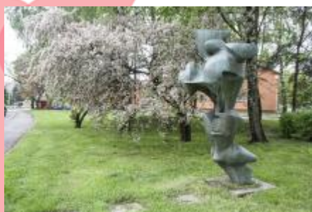
Památník osvobození 2017/JI