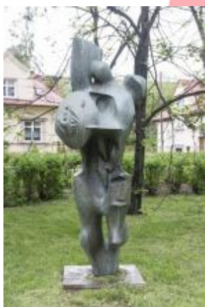
Památník osvobození 2017/JI