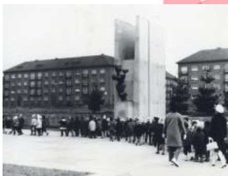
SOKA Karviná, Sběrka obrazového materiálu, fotografií a fotonegativů, neinventarizováno.