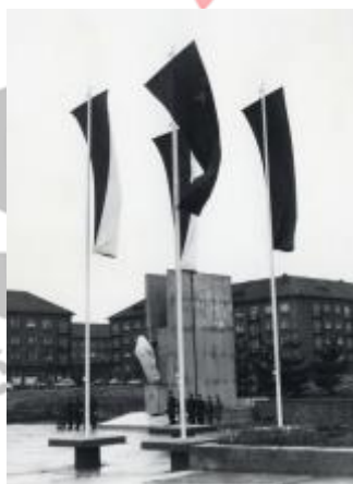
Památník při odhalení sochy, SOKA Karviná, Sběrka obrazového materiálu, fotografií a fotonegativů, neinventarizováno.