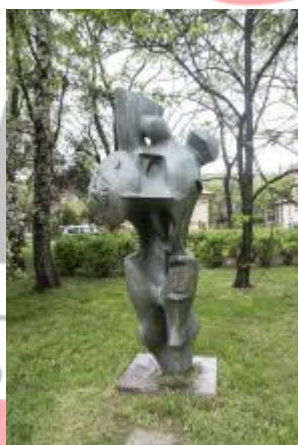
Památník osvobození 2017/JI