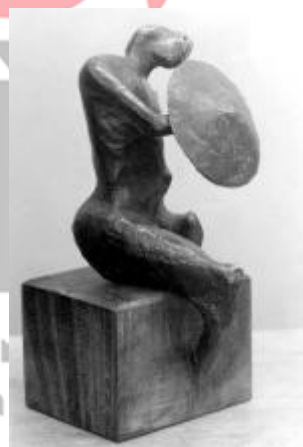
Henry Moore: Bojovník se štítem, 1952-53, Staatsgalerie Stuttgart.