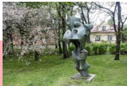
Památník osvobození 2017/JI