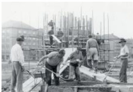
Během stavby památníku, asi 1970, SOKA Karviná, Sběrka obrazového materiálu, fotografií a fotonegativů, neinventarizováno.