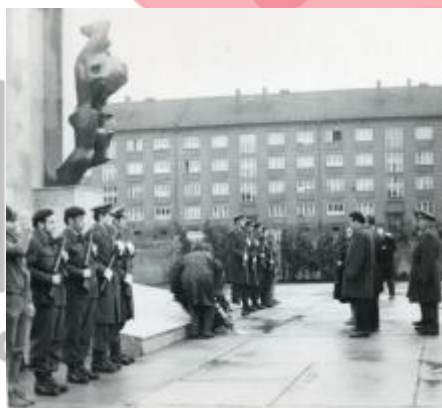
SOKA Karviná, Sběrka obrazového materiálu, fotografií a fotonegativů, neinventarizováno.