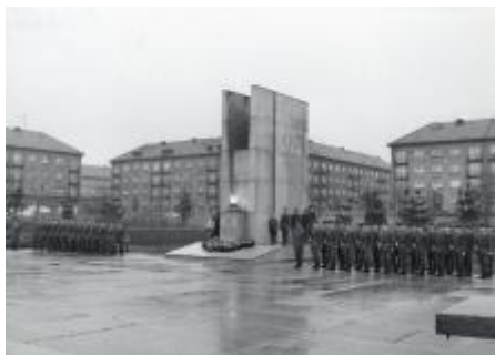
Po odstranění sochy bojovníka, asi 1972, SOKA Karviná, Sběrka obrazového materiálu, fotografií a fotonegativů, neinventarizováno.