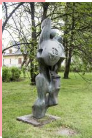
Památník osvobození 2017/JI