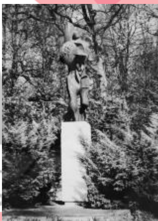
Umístění v sadu Boženy Němcové, z Katalogu památek města Karviné, 1985, uloženo v SOKA Karviná.