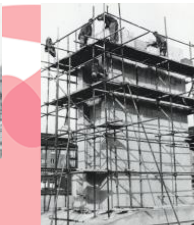
Během stavby památníku, asi 1970, SOKA Karviná, Sběrka obrazového materiálu, fotografií a fotonegativů, neinventarizováno.