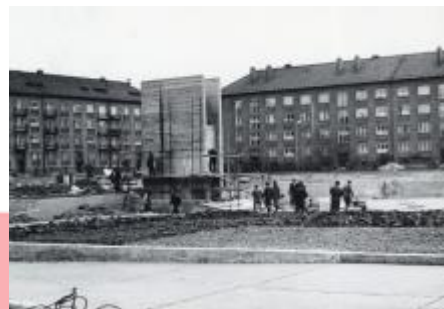
Během stavby památníku, asi 1970, SOKA Karviná, Sběrka obrazového materiálu, fotografií a fotonegativů, neinventarizováno.