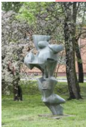
Památník osvobození 2017/JI