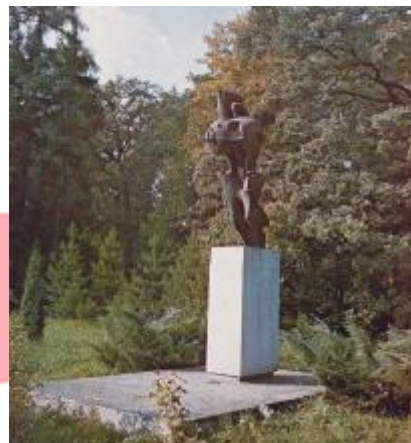
Umístění v sadu Boženy Němcové, foto Ivan Straňák, z publikace Okres Karviná, Ostrava 1984.