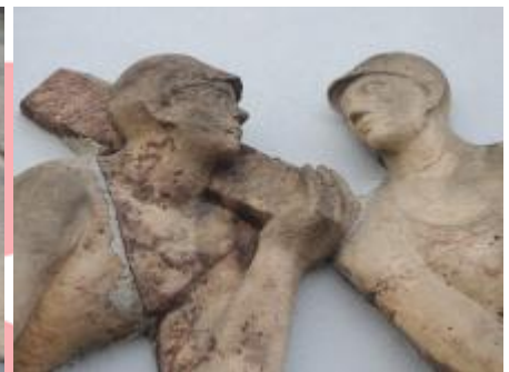
detail reliéfu Hornictví 2019/JI