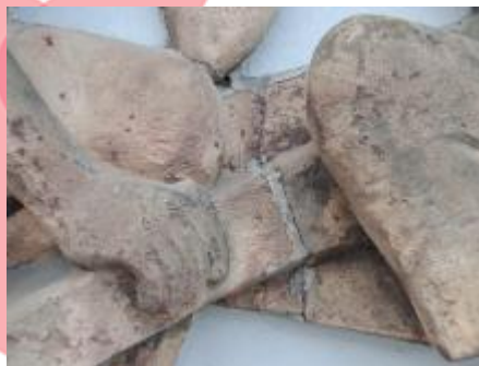
detail reliéfu Hornictví 2019/JI