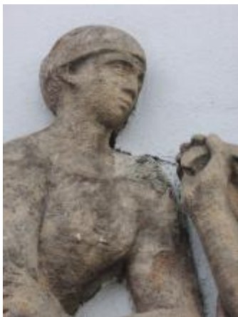
detail reliéfu Lázeňství 2019/JI