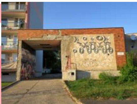
Pravý reliéf s odstraněným vegetačním krytem (09/2019/JJ)