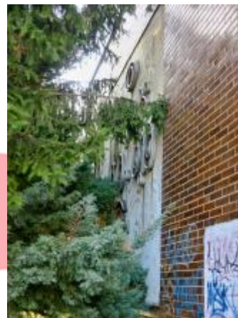
Levý reliéf stav v roce 2019 (09/2019/JJ)