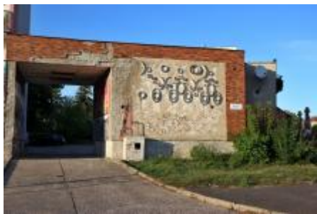
Pravý reliéf s odstraněným vegetačním krytem (09/2019/VD)