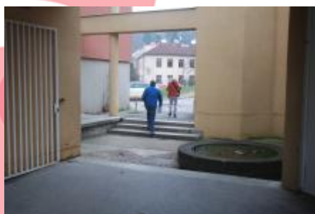
průchod na Juliánovské náměstí (2/2024, KK)