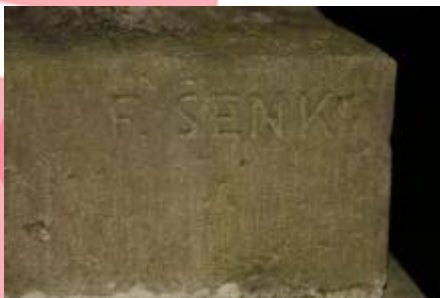
Signatura, 11/2019 VŘ