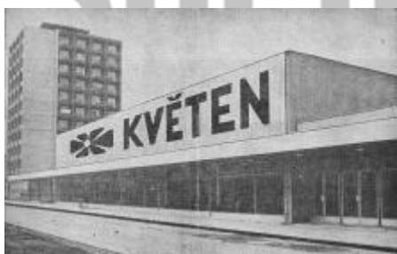
Václav Janda, Malé knížky Kladenské záře 3 , Kladno 1973, s. 90.