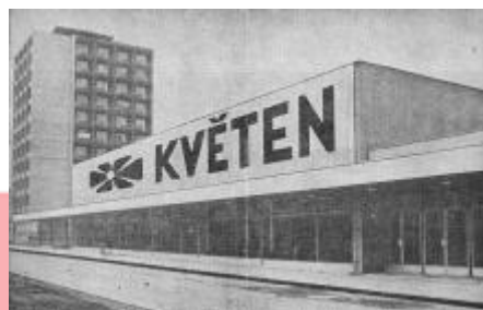
Václav Janda, Malé knížky Kladenské záře 3, Kladno 1973, s. 90.