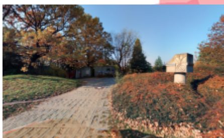
Stav ze 30. 10 2021

( https://mapy.cz/zakladni?pano=1&q=lesnick%C3%A1&source=base&id=2365826&pid=75010814&newest=1&yaw=4.634&fov=1.257&x=16.6151764&y=49.2160366&ds=2&z=19 )