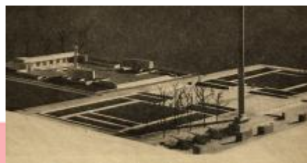
Red., Památník hrdinství v Brně, Československý architekt XXVI, 1980, č. 13, s. 3.