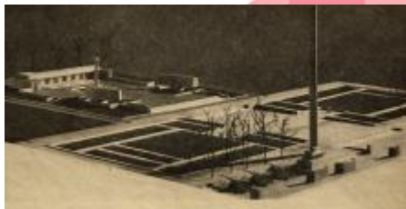
Red., Památník hrdinství v Brně, Československý architekt XXVI, 1980, č. 13, s. 3.