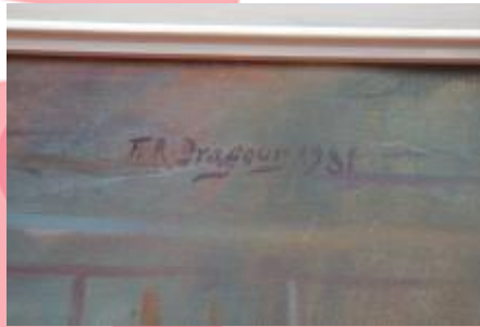
signatura (4/2024, KK)