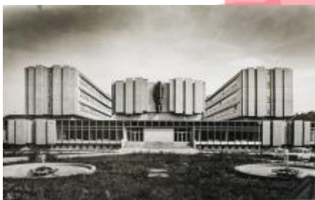
skica průčelí budovy výzkumných ústavů, arch. Jan Dvořák