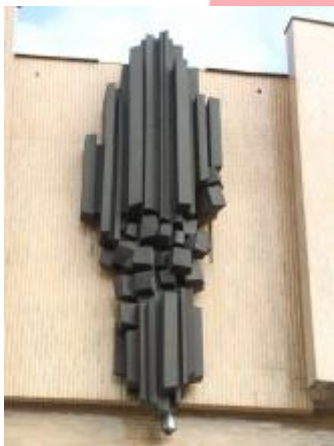
2007, Tomáš Hladík