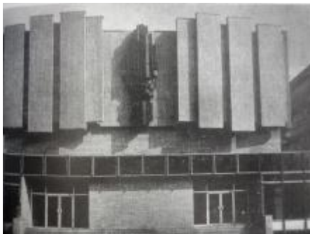
Marie Benešová, Provozní budova Výzkumného ústavu pozemních staveb v Brně, Architektura ČSR XLVII, 1988, č.6, s. 62-65.