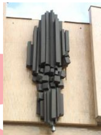
2007, Tomáš Hladík