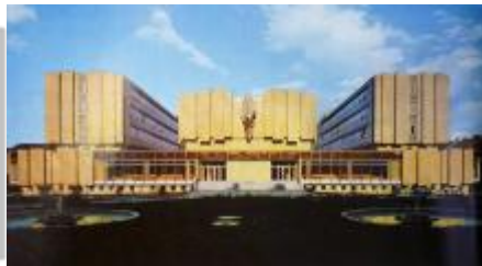
Marie Benešová, Provozní budova Výzkumného ústavu pozemních staveb v Brně, Architektura ČSR XLVII, 1988, č.6, s. 62-65.