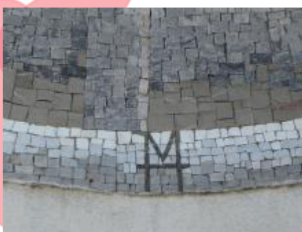
signatura autora, 7/2018 ZK