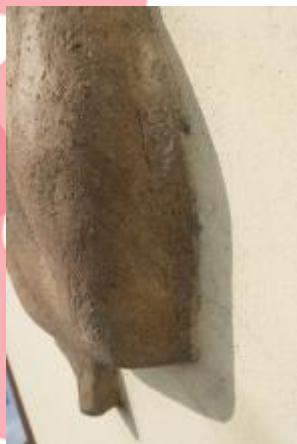
signatura, 4/2018 MČ