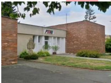
Celkový pohled (08/2018/JJ)