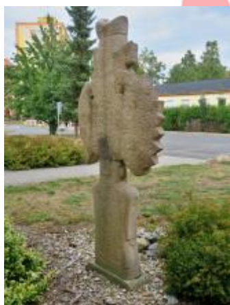
Zadní pohled (08/2018/JJ)