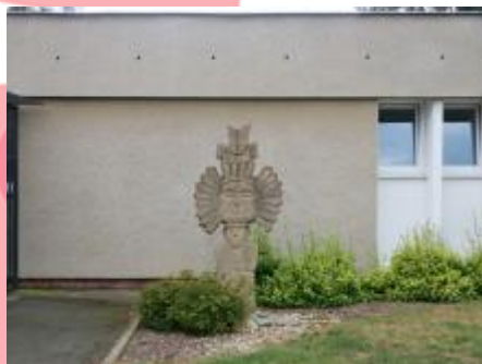
Celkový pohled (08/2018/JJ)