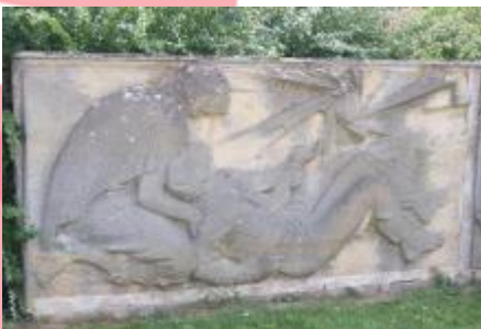
vnější reliéf levého křídla (7/2018, KK)