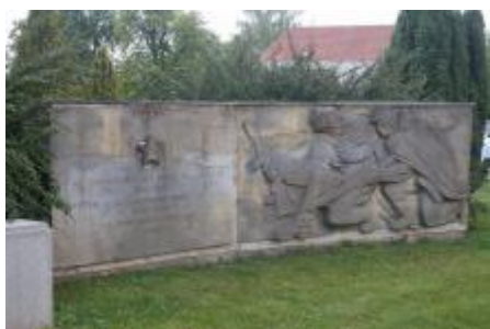
pravé křídlo (7/2018, KK)