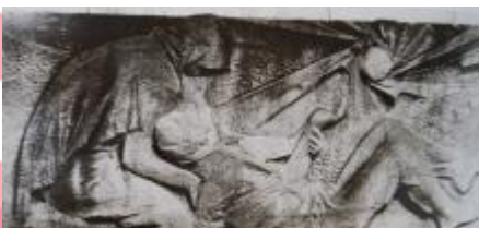
Zdeněk Čubrda, Miloš Axman, Praha 1988, obr. 72.