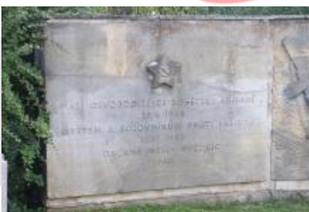
vnitřní reliéf pravého křídla (7/2018, KK)