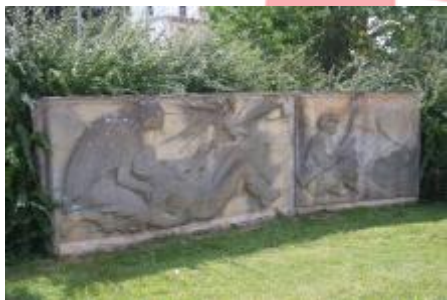
levé křídlo (7/2018, KK)