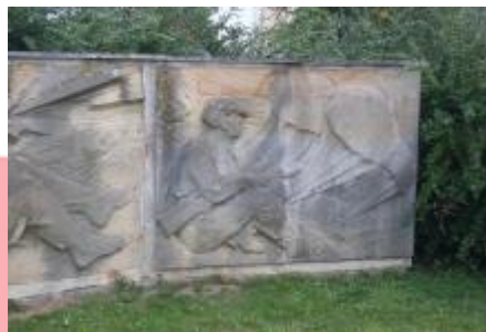
vnitřní reliéf levého křídla (7/2018, KK)