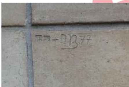
signatura, 11/2018 VŘ