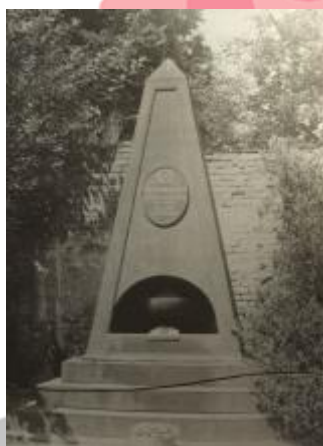
Milena Flodrová, Brněnské hřbitovy, Brno 1992, s. 58.