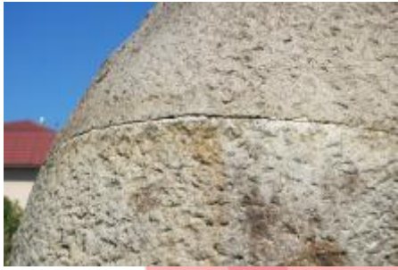
Prasklina (9/2019 KK)