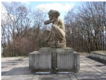
Původní umístění, foto:Tomáš Hladík 2007.