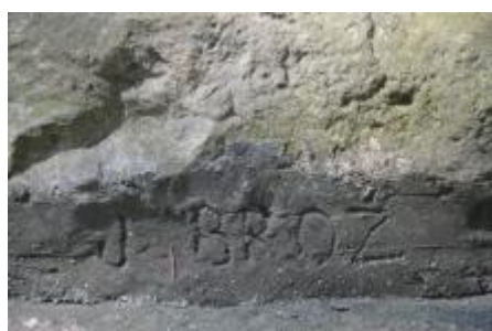
Detail signatury.